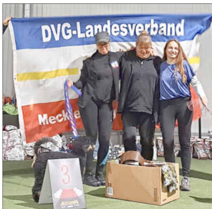
Mannschaft aus M-V, Sachsen