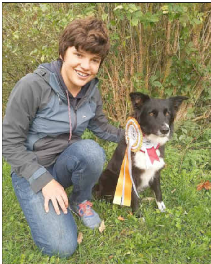
(Finja + Bella)

Konni und Emma erlebten sich in der A2 Large 2 erste Plätze und u.a. die 4. Quali für die A3.