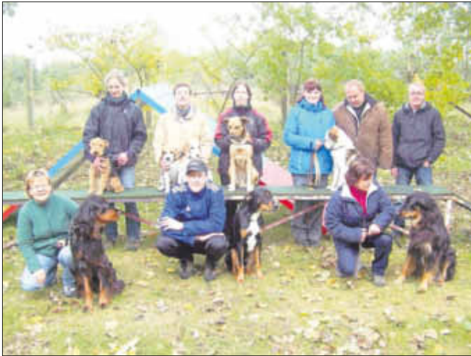
Teilnehmer der Herbstprüfung.